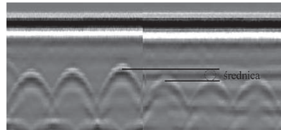
Rys. 2. Określenie średnicy zbrojenia na falogramie – lewa strona badanie w kierunku prostopadłym do pręta górnego, prawa w kierunku prostopadłym do pręta dolnego.

które powstały prawdopodobnie na skutek zbyt wczesnego podrywania deskowania ślizgowego. Uszkodzenia te na skanach (środkowa kolumna - rys. 3) widoczne są w postaci nieregularnych obiektów o rozmytych krawędziach.